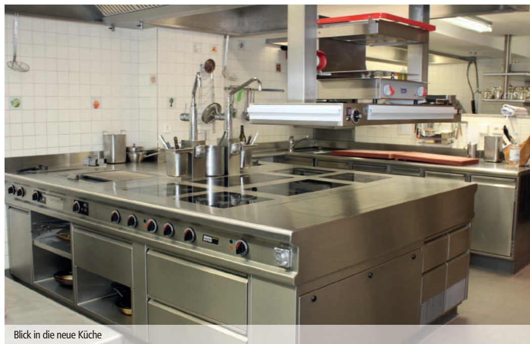
Blick in die neue Küche