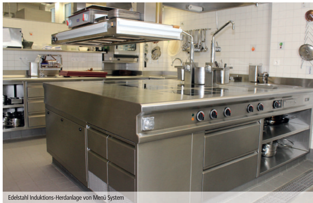
Edelstahl Induktions-Herdanlage von Menü System