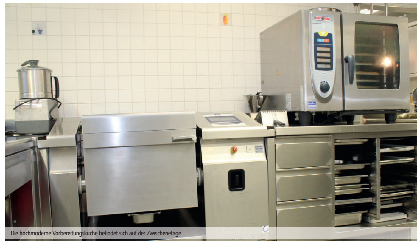
Die hochmoderne Vorbereitungsküche befindet sich auf der Zwischenetage